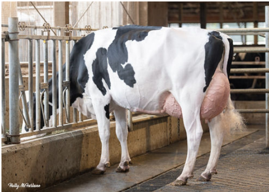
PROGENESIS ZAZZLE PUZZLE GRANDDAM