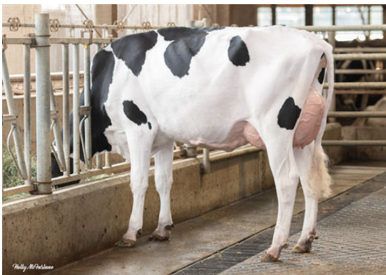
PROGENESIS FELLOWSHIP PUDDLES DAM