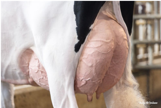
PROGENESIS ZAZZLE PUZZLE GRANDDAM